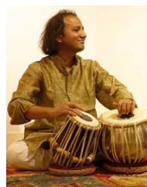
Ustad Latif Khan

Mit der Kunst des Alap wurde in Indien eine einzigartige musikalische Darbietungsform von hoher Mitteilungskraft geschaffen. Die langsame, systematische und kontemplative Vortragsweise erlaubt auch dem Aussenstehenden, einen Raga nicht bloß zu hören, sondern ihn auch zu verfolgen, kennenzulernen und zu verstehen.